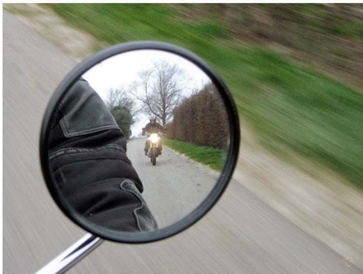
Weer bewust leren spiegelen